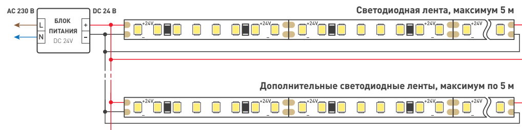
Схема 1. Подключение нескольких светодиодных лент с двух сторон